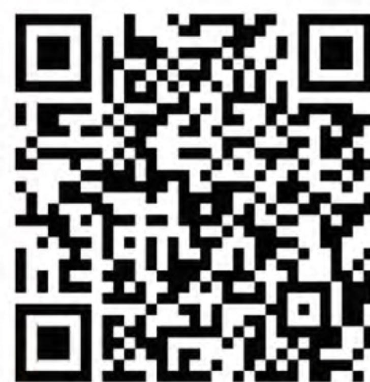
都市計畫法新北市施行細則