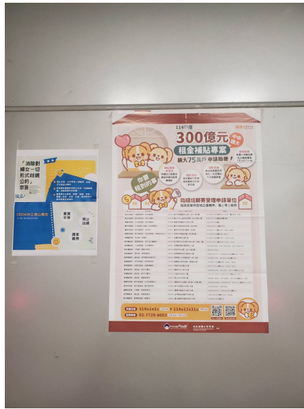
▲114 年度住宅補貼現場受理申請情形