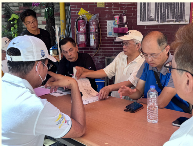
▲更新會討論案件推動

「富豪社區」位於板橋區中山路二段，基地面積達 3,457 平方公尺，原為 5 層樓鋼筋混凝土建物，屋齡逾 30 年，共有 68 戶住家。自 108 年被鑑定為海砂屋，甚至出現房屋傾斜、樓板剝落等情況，重建的急迫性日益凸顯，因此住戶決定採自主都更方式重建，最終本案事業及權利變換計畫順利在 113 年 5 月 8 日核定實施。