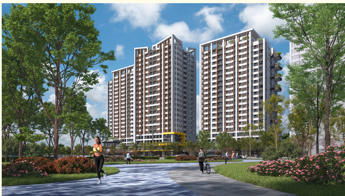
▲塹仔圳社會住宅示意圖，擁有最完善的公益設施