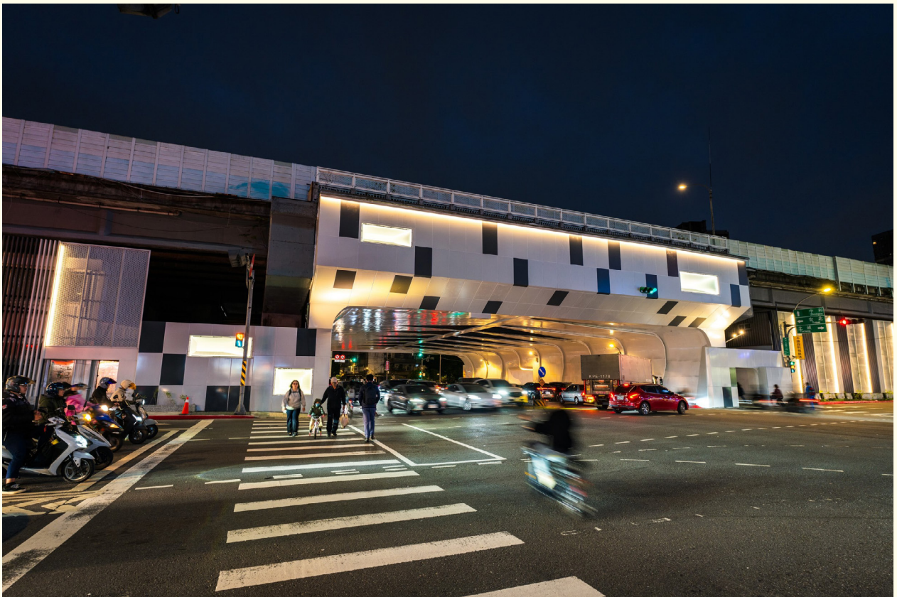
▲ (改善後) 透過立面及人行道改善工程，點亮城市，並提供安全的步行環境