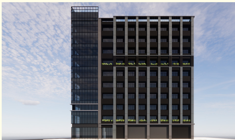
▲ 三重案更新後模擬圖