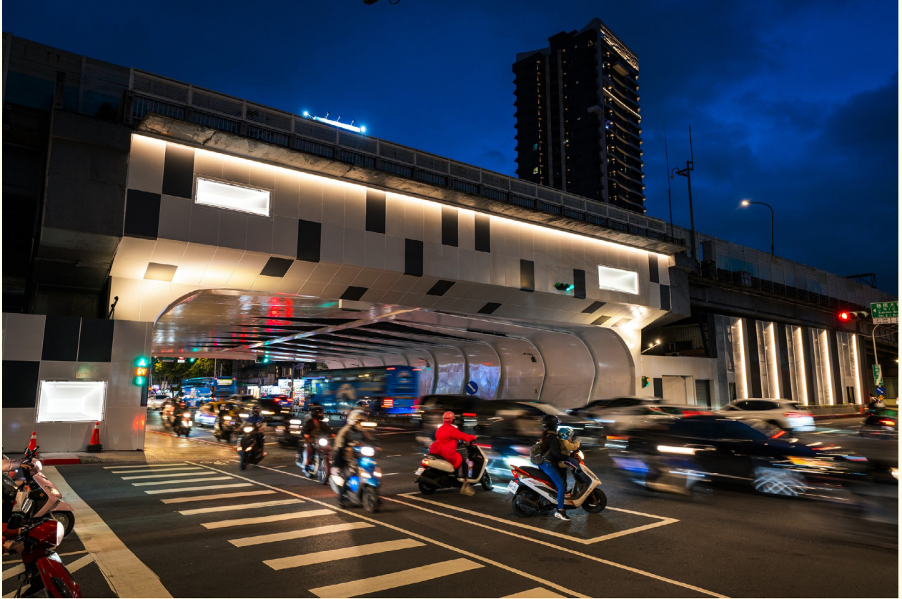
▲ (改善後) 夜晚輔以暖色光，打造溫暖的城市氛圍