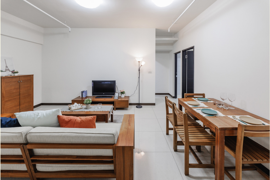
▲二房型客餐廳擺設示意