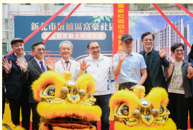
▲動土典禮圓滿完成