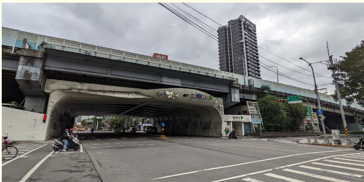
▲ (改善前) 民生陸橋是串聯板橋、新莊與中永和的重要交通節點，也是雙北往來的關鍵動線之一，惟環境老化、影響市容

考量民生陸橋為交通要道平日交通流量巨大，工程期間必須維持通行順暢，僅得於夜間施工，實際可作業時間僅約 4 小時。施工團隊在時間受限的情況下，克服現場條件與交通壓力，順利完成改善，將影響降到最低。民生陸橋周邊改善並非單純外觀整理，而是回應市民日常使用的實際需求。後續也將持續檢討周邊步行環境，逐步擴大改善民生路人行道，讓板橋的步行空間更安全、更舒適，打造貼近生活的公共環境品質。