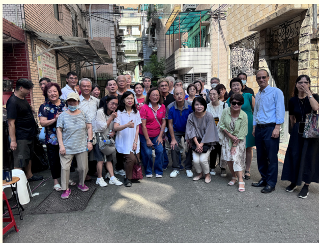
▲富豪社區住戶與更新處合照