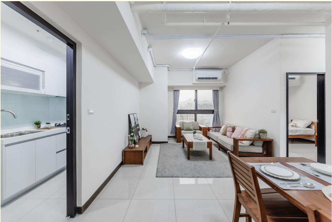
▲三房型客餐廳擺設示意