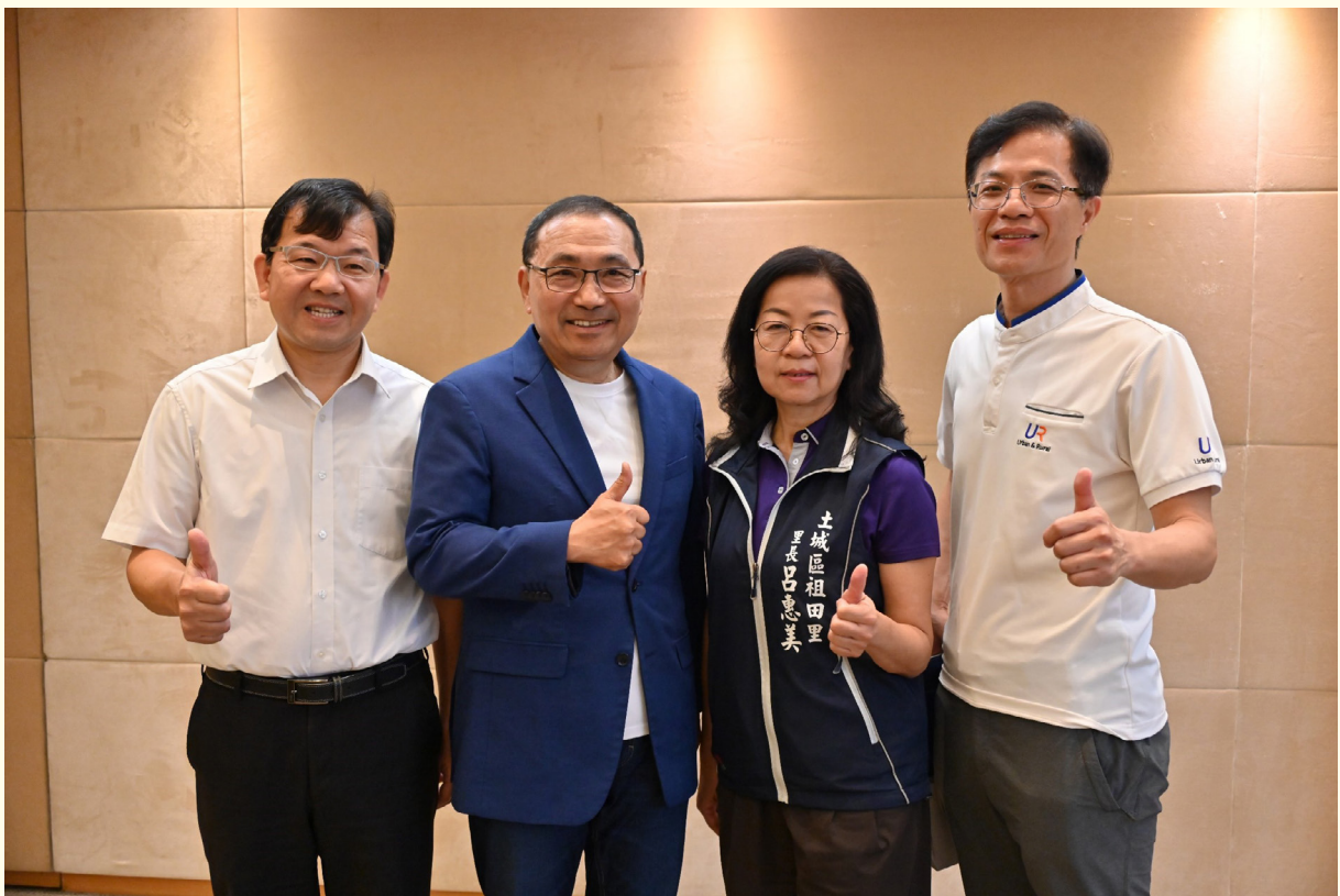
▲社區營造重要推手土城區祖田里呂惠美里長與侯友宜市長、城鄉局黃國峰局長及民政局林耀長局長合影