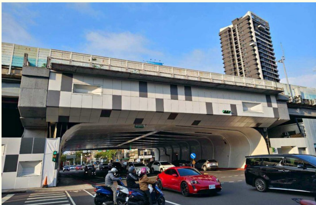
▲ (改善後) 白天以跳色方塊，營造大器門戶