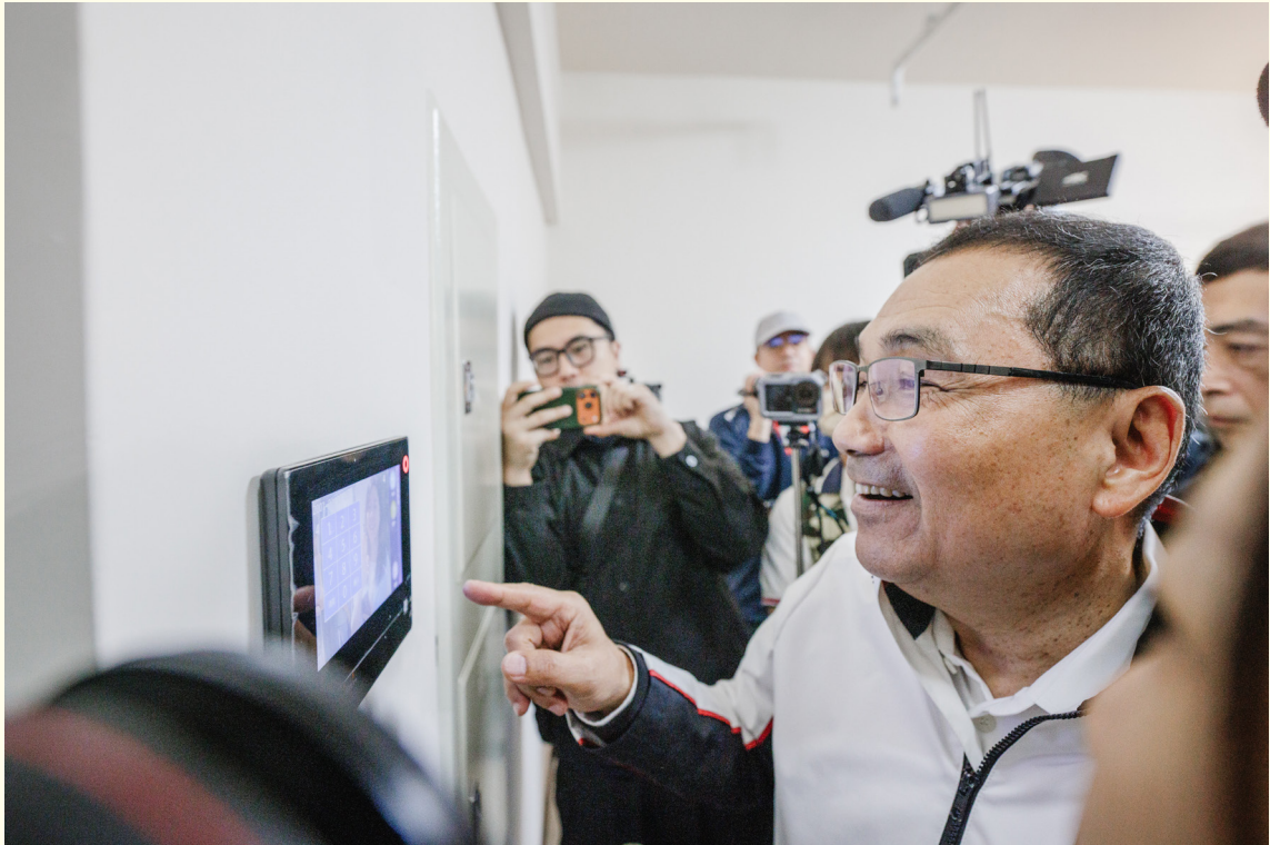
▲侯友宜市長測試智慧對講系統