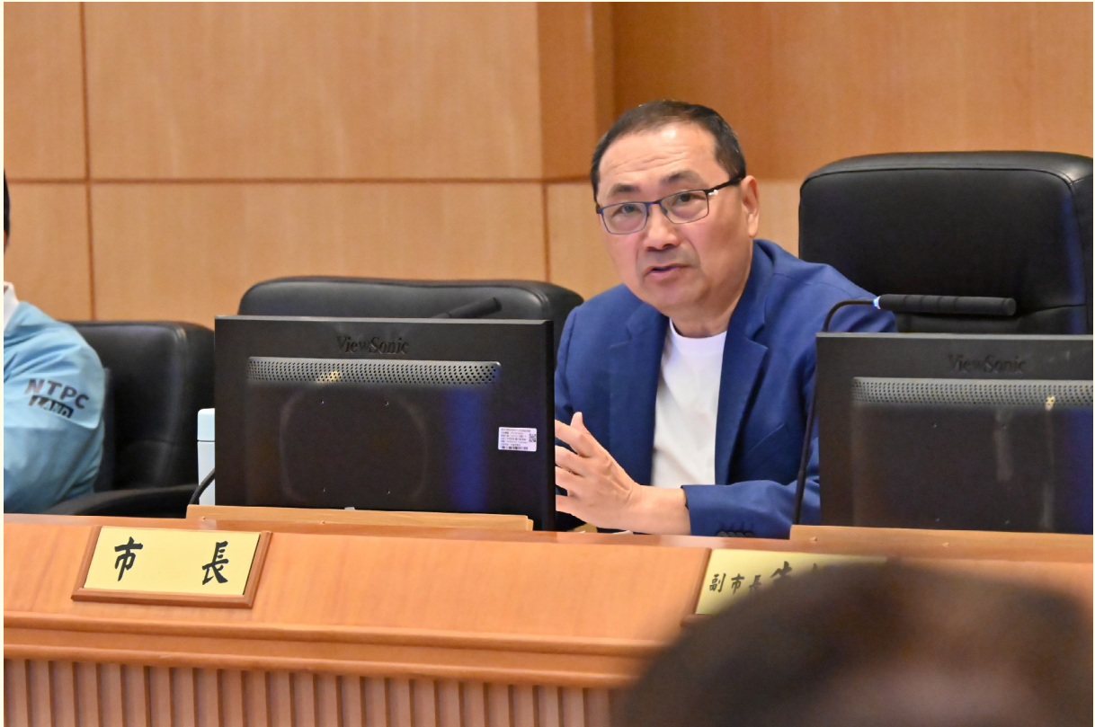
▲市長裁示城鄉局市政會議簡報