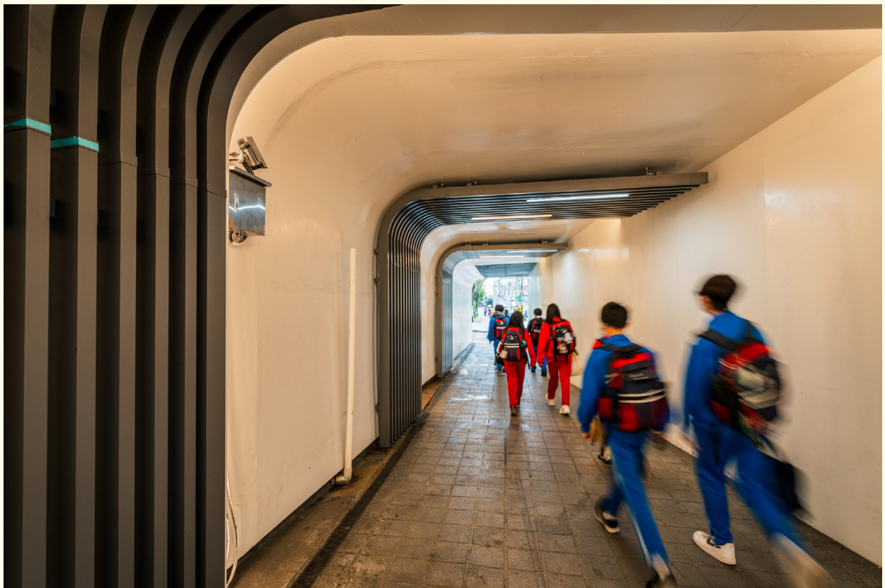
▲ (改善後) 陸橋改善後的環境更加明亮清楚，讓市民行走時，多了一份安心與順暢