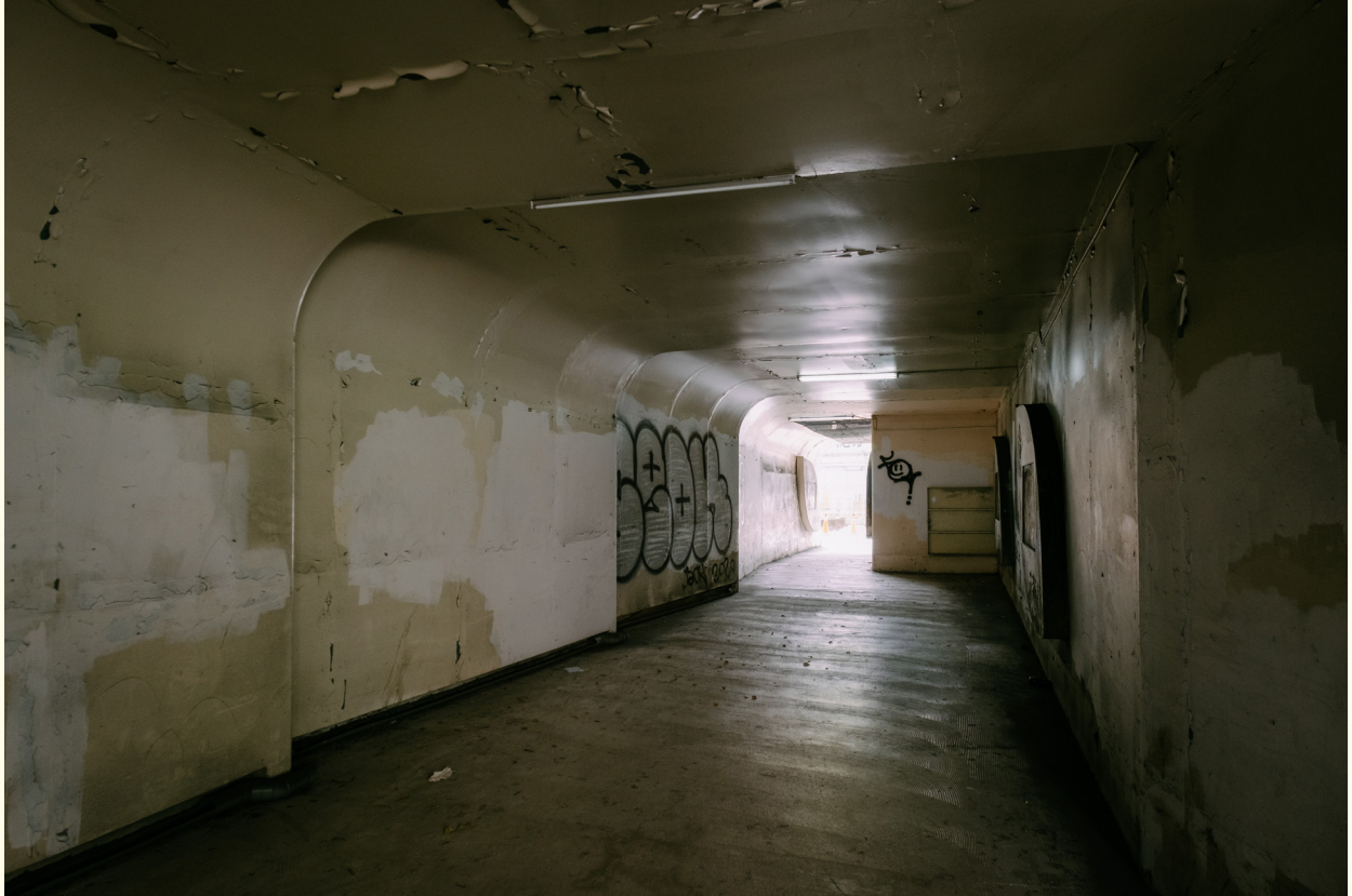
▲ (改善前) 橋下通行穿廊照明不足、塗鴉髒亂