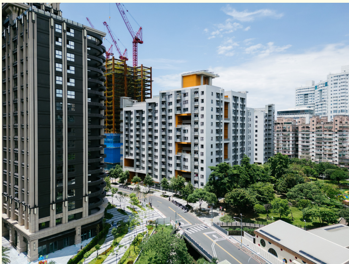
▲新北市土城員和青年社會住宅、土城員和 2 號社宅共同打造全齡生活服務網