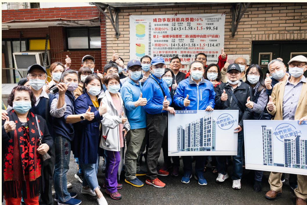
▲ 富豪社區住戶與市長合照