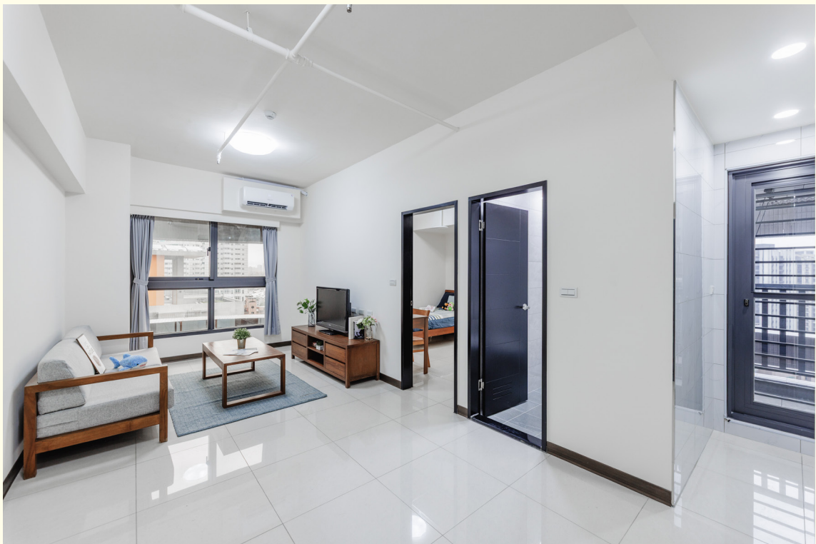
▲一房型客廳擺設示意