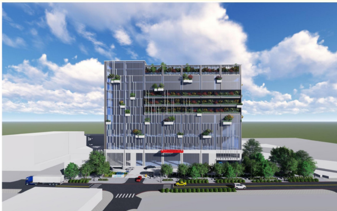
▲土城案更新後模擬圖