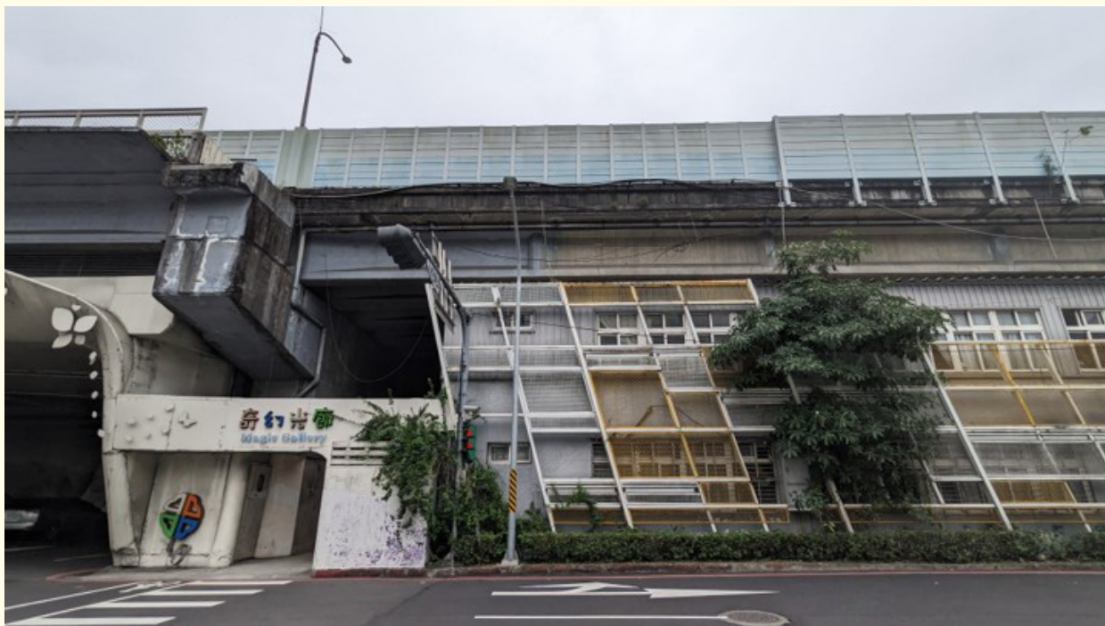
▲ (改善前) 本次改善亦包含橋下活動中心及辦公室立面景觀