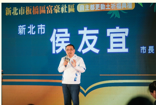
▲市長親臨開工動土典禮

歷經多年整合與努力，新北市政府專案輔導的板橋「富豪社區」海砂屋自主都更案，於 115 年 4 月 23 日舉行開工動土典禮，在新北市長侯友宜、各界貴賓與更新會住戶共同見證下，正式邁入嶄新階段。本案未來將興建 3 棟地上 15 至 19 層、地下 4 層之住商混合大樓，總戶數約 206 戶，預計 118 年底完工。