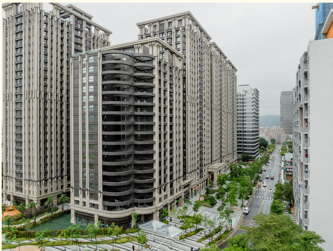
▲土城員和 2 號社會住宅外觀照