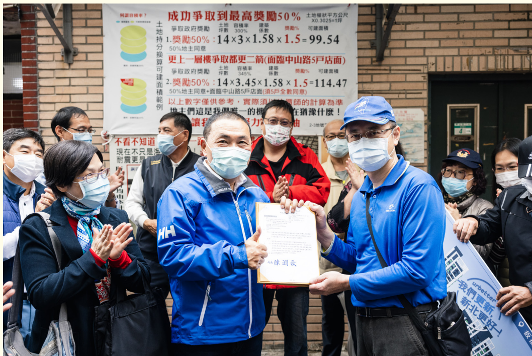
▲ 109 年市長親頒都更二箭資格函

本案依「都更二箭 - 主幹道沿線都更」政策，取得 15% 基準容積加給，讓基準容積從 300% 提高至 345%，並回饋約 784.58 平方公尺公共托老中心，完善在地長照服務機能，透過都市更新，不僅提升建築安全，也同步打造兼具機能與人本關懷的現代化社區。