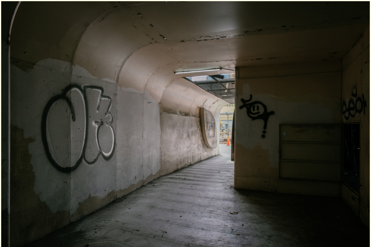
▲ (改善前) 橋下通行穿廊照明不足，塗鴉髒亂