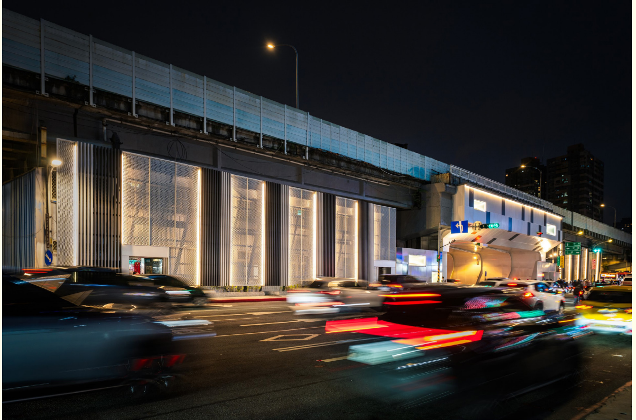
▲ (改善後) 點亮回家道路、營造市民返家的溫暖意象