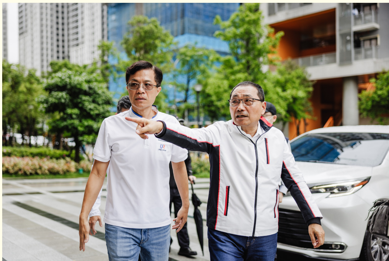
▲ 侯友宜市長前往土城員和 2 號社會住宅替大家把關工程進度、施工品質

侯友宜強調，新北市持續透過自行興建、容積獎勵捐贈、多元社福及公有地都更分回等多元管道擴充社宅資源，目前興辦社宅已達成 2.3 萬戶，其中容獎捐贈累積 1,277 戶；未來規劃擴充量體達 4.1 萬戶。市府將持續推動社會住宅、包租代管及租金補貼等多元居住扶助政策，落實居住正義，為市民營造安居樂業的環境。