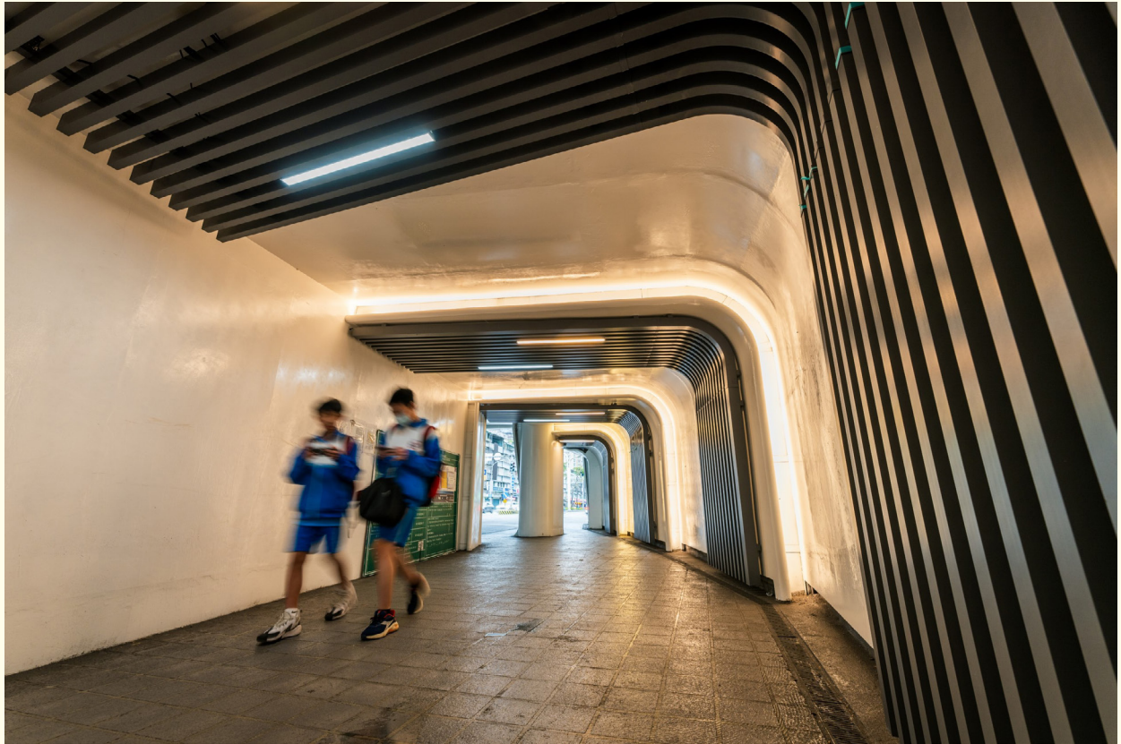
▲ (改善後) 民生陸橋改善後讓通行更清楚、安全，也讓公共空間更貼近日常需求