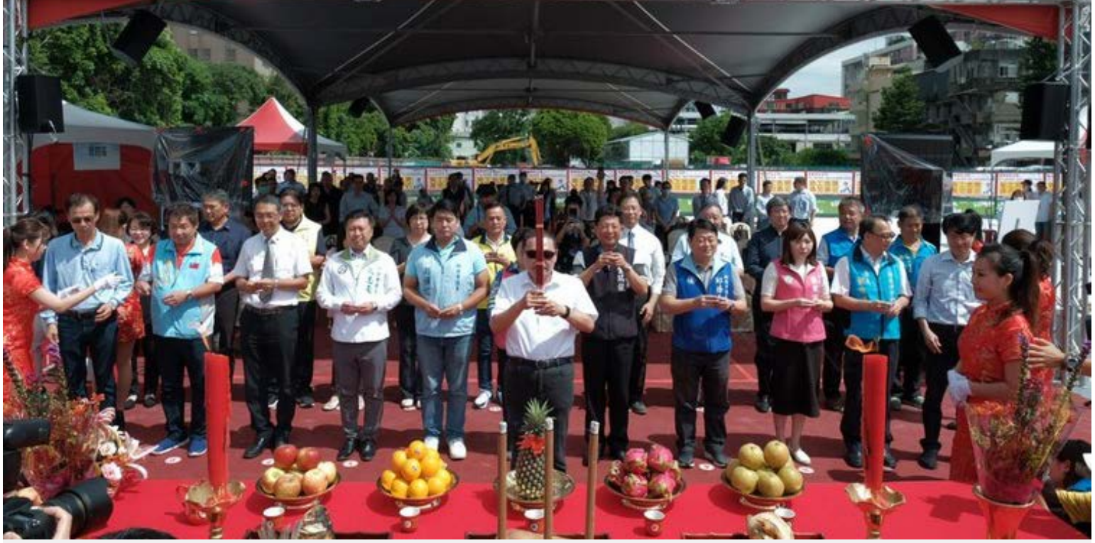
【▲侯市長特地到場主持開工動土典禮】