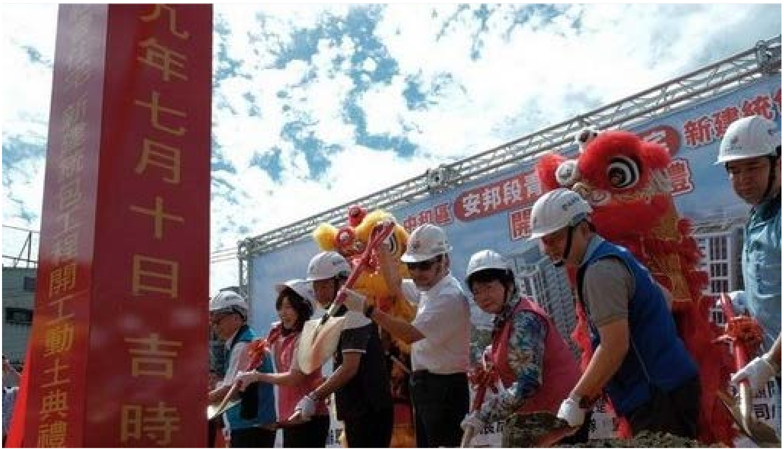
【▲新北市長侯友宜主持開工典禮】