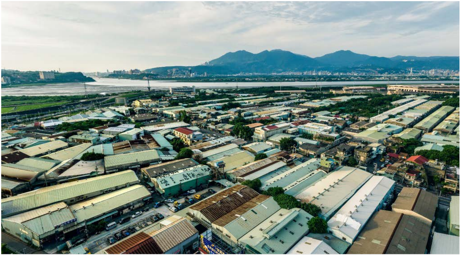
【▲蘆洲北側農業區現況照片】