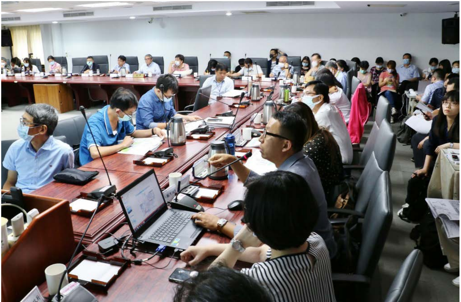
【▲內政部國審會大會會議照片】