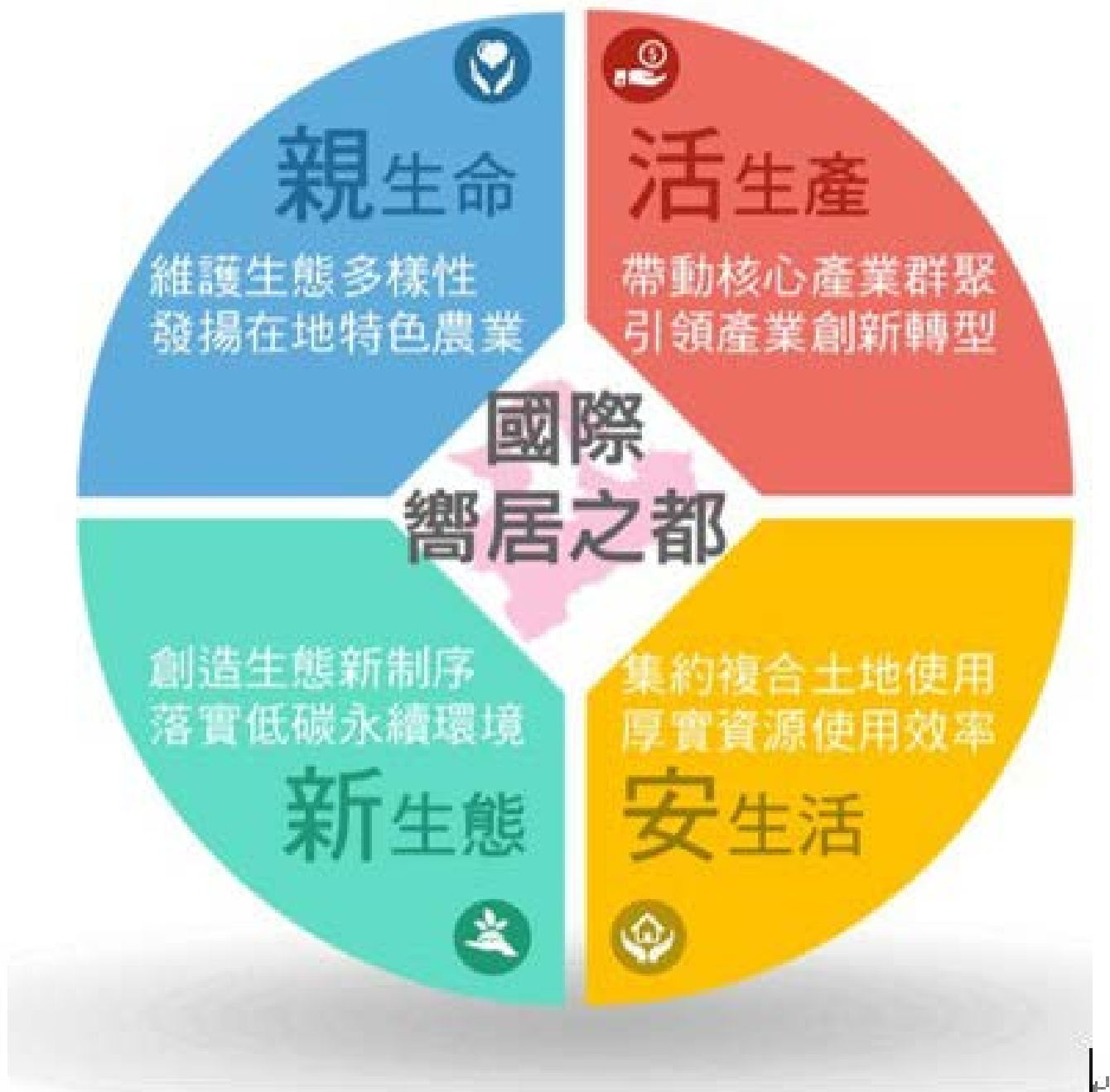
【▲新北市國土計畫發展願景與目標示意圖】