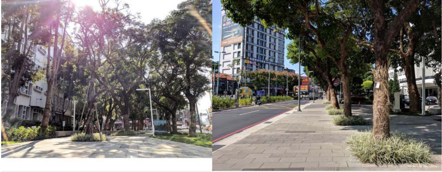
【▲美化都市景觀，營造都市廣場及人本空間環境 營造大面積透水環境，降低都市熱島效應】

調整、設施調整拆除、土地空間開放，並納入通用設計，讓男女老幼、身障或行動不便等使用族群均可通行無礙，透過節點的活絡帶動整個新、舊板橋整體的發展與都市環境的優化，提供都市居民更好的生活品質。