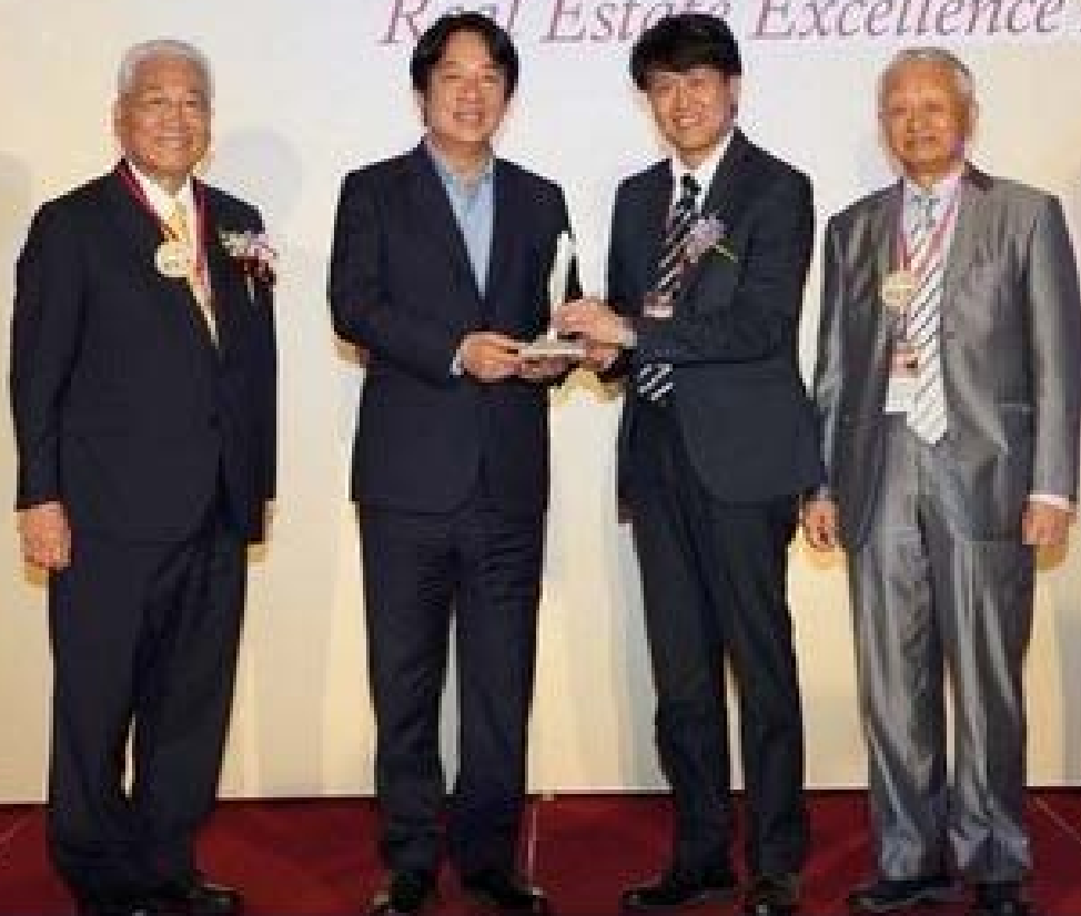
【▲中華民國不動產協進會理事長林長勳(左一) 副總統賴清德(左二) 黃南淵2020評審團總召集人(右一)城鄉發展局局長黃一平(右二)】