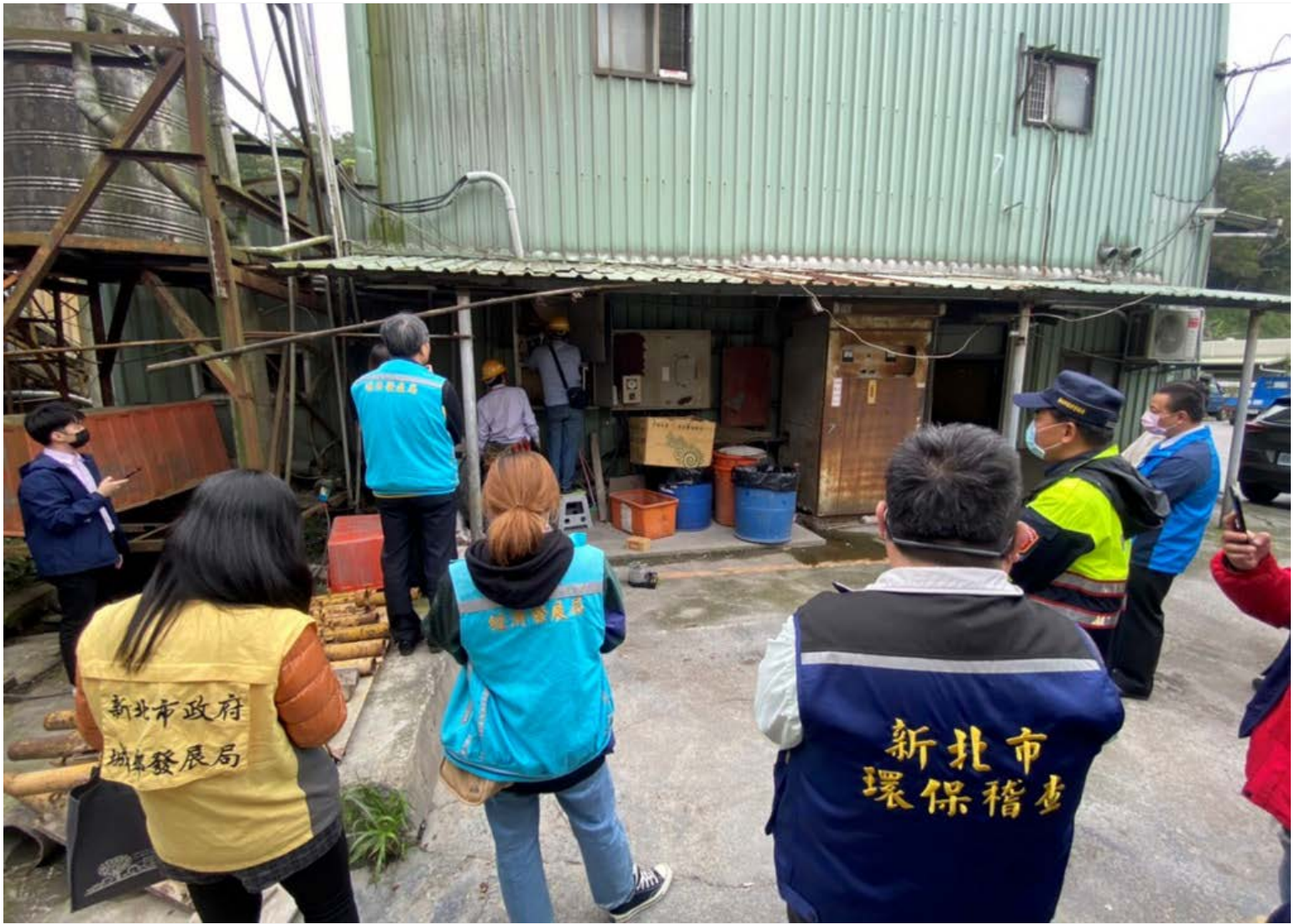
【▲市府相關單位針對違規業者，執行斷水電處分】