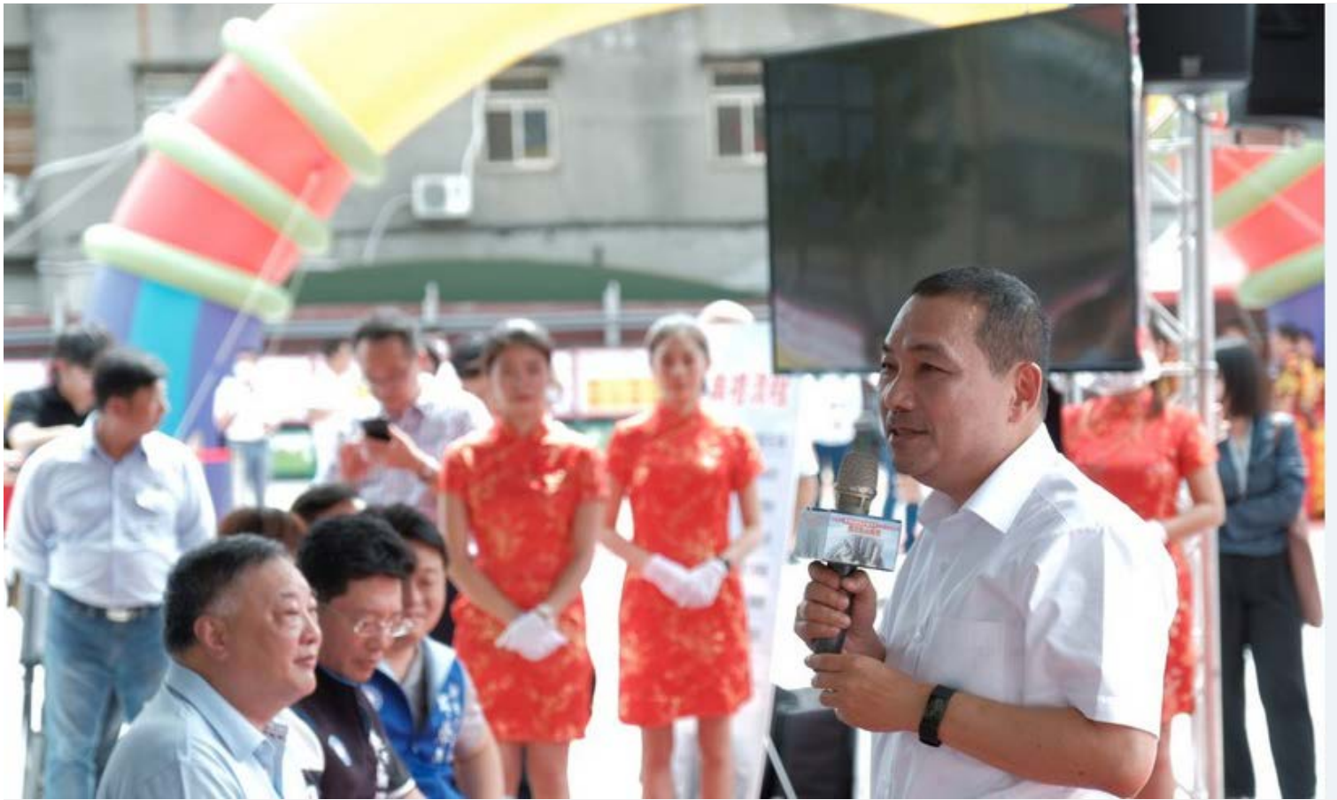
【▲市長表示中和安邦社宅堪稱新北最便利社宅】