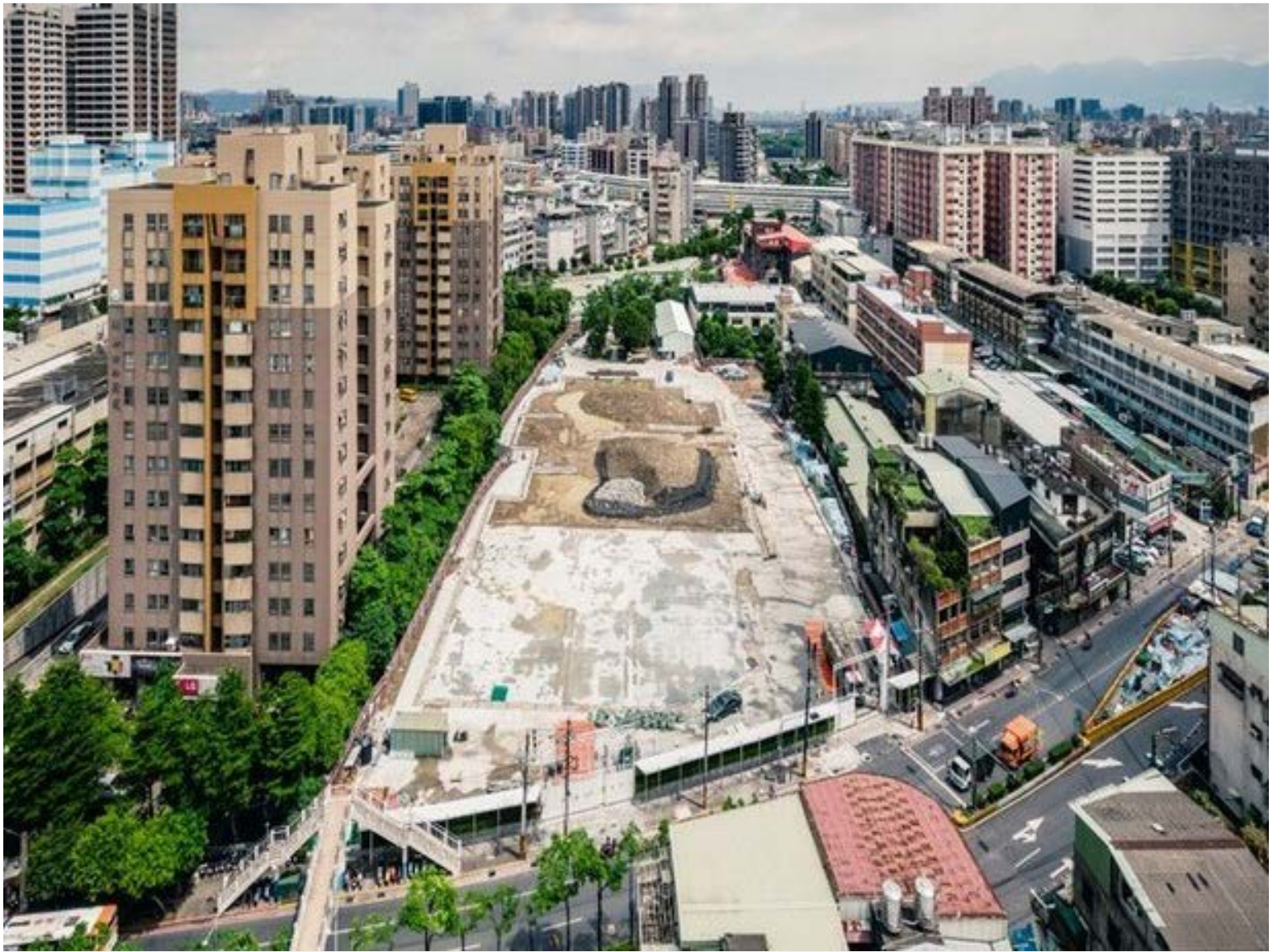
【▲近捷運站及大型商場生活機能佳】