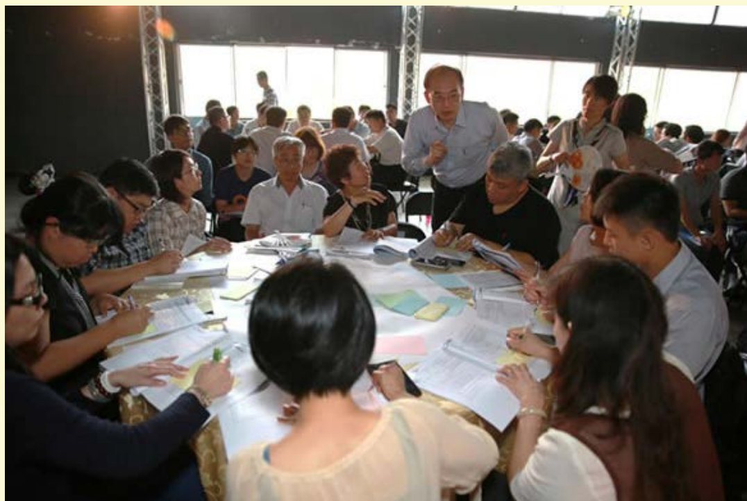
【▲104年5月15日辦理北臺發展工作坊】

北臺平臺與金馬澎組成的離島平臺簽署合作備忘錄，就農漁特展共展、圖書資源共享等7項簽定合作，未來讓金馬澎的小朋友可以免跨海申請就可以擁有新北圖書證，借閱豐富的圖書資源。第二項是北臺平臺與智慧綠能產業界簽署永續合作宣言，作為推動北臺發展智慧綠能產業發展的第一步。