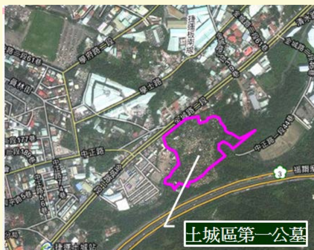
【▲土城醫院周圍環境示意圖】

計畫區於101年9月辦理土城第一公墓遷葬時發現斬龍山文化遺址，新北市政府文化局於102年6月依文資法辦理遺址搶救發掘作業，另由工務局接續辦理遷葬作業，衛生局同步辦理建院預定用地上的部分私有地取得及招商前置規劃作業，後由招商得標廠商於104年11月依山坡地開發相關規定完成環境影響評估及水土保持計畫。