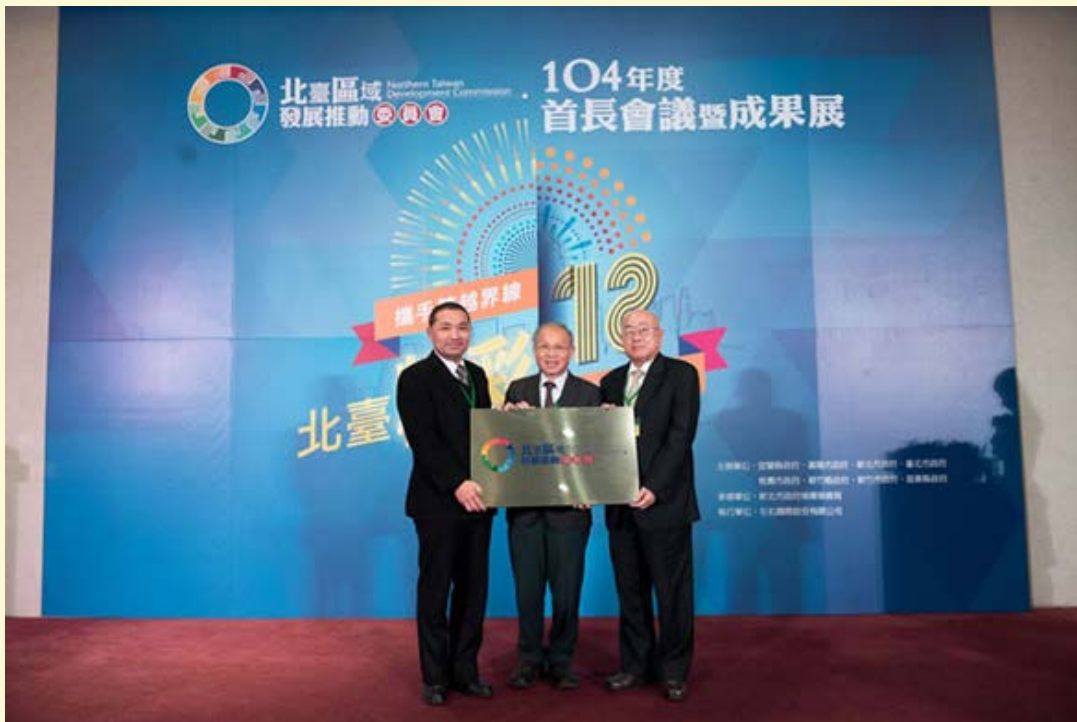
【▲北臺主政縣市交接儀式】

北臺灣 8 縣市共同組成的「北臺區域發展推動委員會」首長會議及交接典禮於 104 年 12 月 29 日舉行，由行政院 2 位政務委員、國家發展會、北臺 8 縣市、3 離島縣市及多達 16 家智慧綠能產業界代表聚一堂。會議中 104 年主政之新北市政府將北臺東主移交給新竹市政府，輪職並落實北臺平台合作的精神。此外，本次會議更揭示兩大區域合作主軸，第一項是