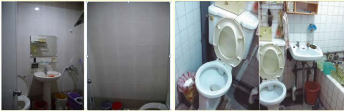
【▲修繕後廁所煥然一新】