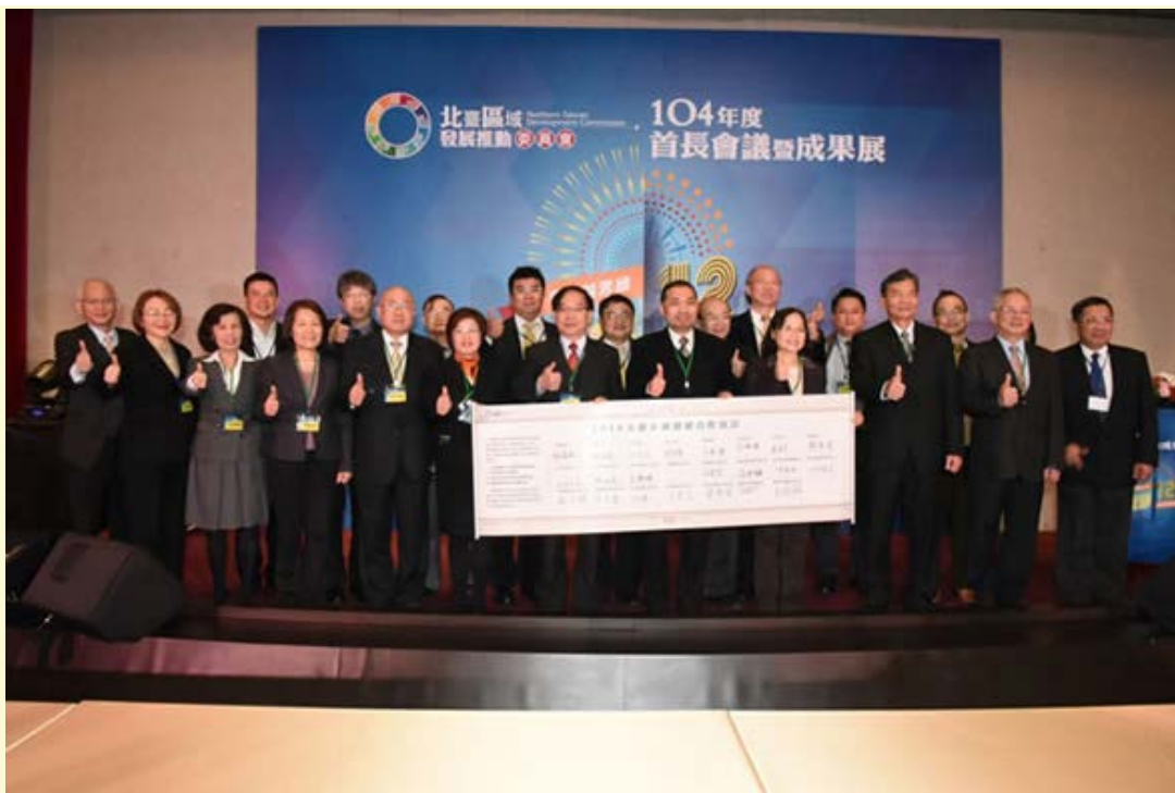
【▲北臺8縣市首長與智慧綠能產業代表簽署合作宣言】