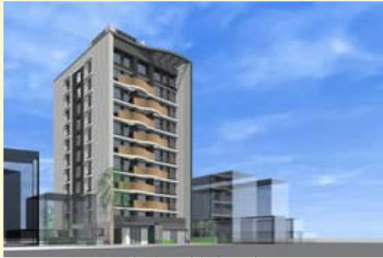
【▲第5案重建模擬示意圖】

防火間隔、停車空間及電梯，也提供舒適順暢的4公尺人行空間並增設2處街角廣場供居民休憩使用，讓居住環境更加安全舒適。