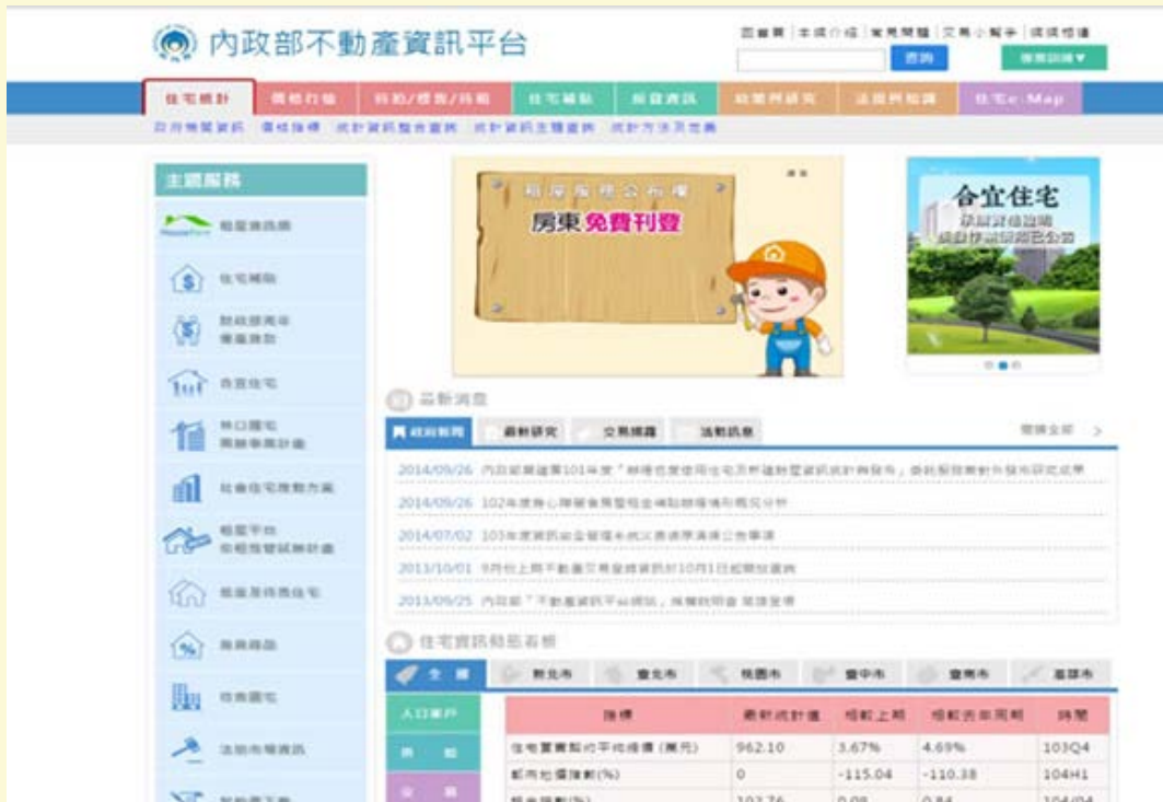
【▲內政部不動產資訊平台網站】

另外，新北市政府辦理住宅租金補貼，104年度經審查符合補貼資格者 9,866 戶，均可全數獲得補貼，補貼戶數佔全國第一。修繕住宅貸款利息補貼亦有 108 戶獲得補助。 105 年度住宅補貼即將於7月中受理申請，相關規定及申請日預計於6月底或7月初公告於本府城鄉局網站，有需要的民眾可先行至內政部不動產資訊平台的住宅補貼專區參考104年度規定(網址： http://pip.moi.gov.tw/ )，屆時請把握機會提出申請。