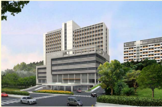
【▲都市設計審查時土城醫院模型照片】

土城醫院將斥資 67億元 興建，動工期程比計畫提前半年，預期會在 2020年7月 開始營運，新北市民將可擁有一座 1,058床 的區域級教學醫院，該院每日可服務 2,000位 門診病患，服務涵蓋 120萬 人口。