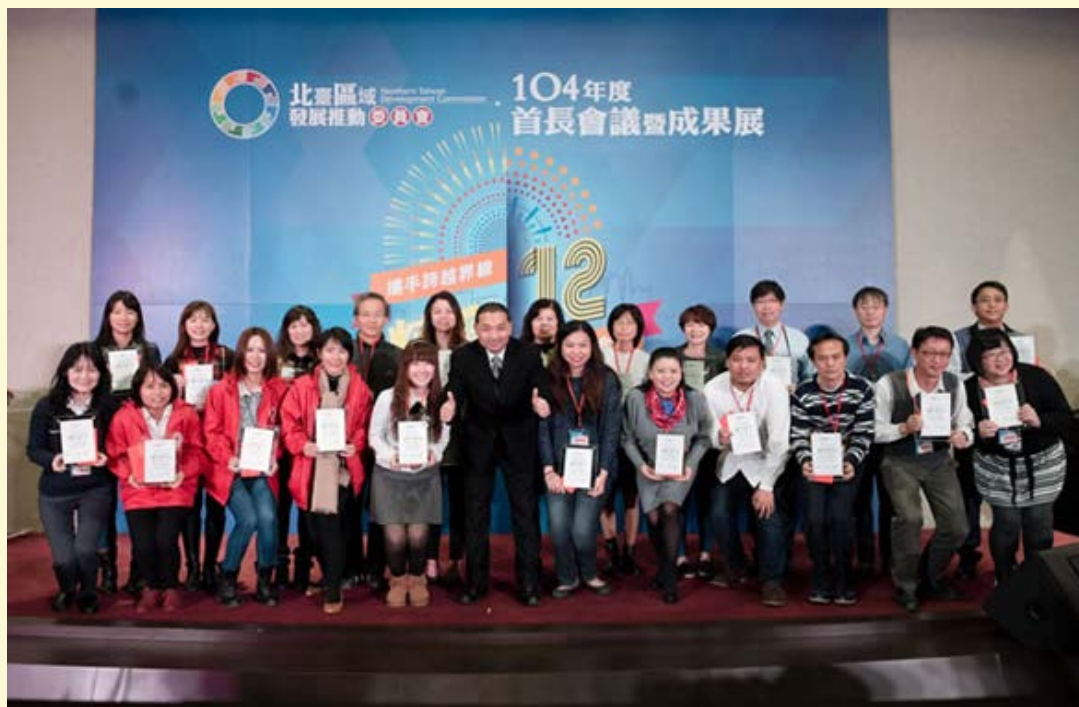
【▲北臺績優議題組頒獎典禮】

會議中八縣市共同觀賞北臺紀錄片，共同見證北臺合作 12 年的精彩不勝枚舉。北臺的精神就是「由下而上」與「自主推動」，北臺合作核心就是「共同有利」到「相容有利」到「互助有利」。合作計畫由下而上向委員會提出，並以協議與共同合作達成區域整合治理，因此 12 年來議題組合作共達 200 多項年度合作計畫及完成 47 項國家建設計畫。精彩 12 不僅只是記錄片上所看到的北臺自行車道共計 26 處斷點縫合及 298 公里路段連接工程、輔導苗栗、桃園、宜蘭永續農業與有機村及推動泰雅山徑計畫等。北臺平台豐碩的成果皆歸功於 8 縣市的積極努力，活動上北臺也透過紀錄短片介紹北臺成果，邀請相關參與人員分享北臺核心精神，並頒發績優服務獎感謝北臺績優人員及績優議題組的付出，更期許以此為目標，北臺 8 縣市將可破除地域及行政疆界限制，共同致力於推動北臺發展，北臺精彩 12，是熱忱，實現了跨域合作的可能；是堅持，完成了攜手共榮的夢想。