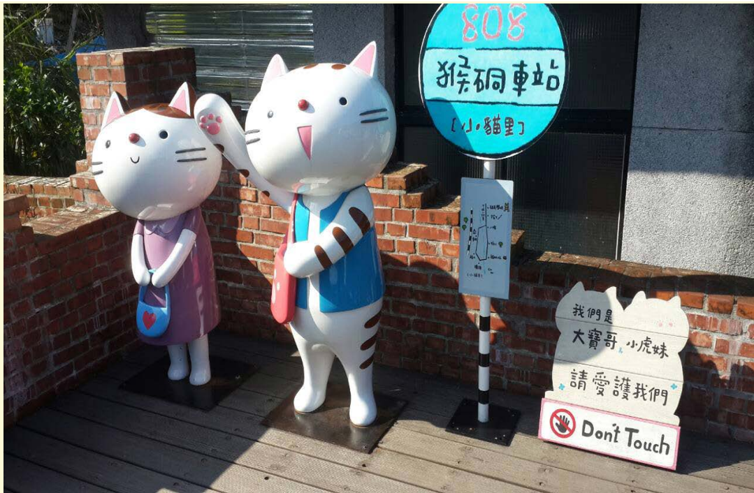
【▲平溪鐵道·侯硛整體風貌環境營造工程】

103年城鎮風貌本府投入總經費3075萬，爭取補助預算共計2091萬，整體表現獲得內政部整體評鑑優等，這樣良好的基礎下104年度共投入總經費6830萬，向中央爭取4576萬補助，綜觀104年城鎮風貌執行效能，未來將增加新北市社區規劃師每年50人、增加綠美化面積約7316平方公尺及增加改善人行步道空間10287平方公尺。