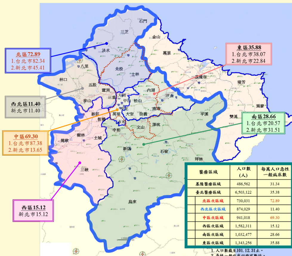
【▲新北市醫療資源統計】