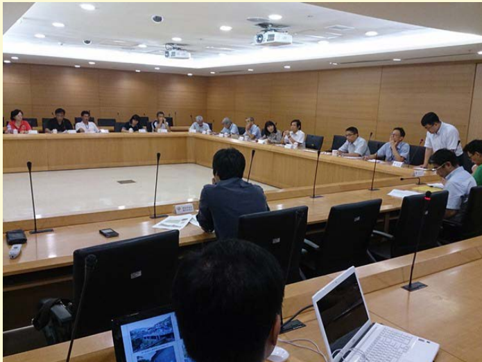
【▲城鄉風貌審查會議示意】

103年城鎮風貌本府投入總經費3075萬，爭取補助預算共計2091萬，整體表現獲得內政部整體評鑑優等，這樣良好的基礎下104年度共投入總經費6830萬，向中央爭取4576萬補助，綜觀104年城鎮風貌執行效能，未來將增加新北市社區規劃師每年50人、增加綠美化面積約7316平方公尺及增加改善人行步道空間10287平方公尺。