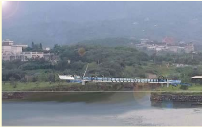
【▲金包里溪跨橋模擬圖-日間】

隱含「鵬程萬里」之意，另為提升夜間景觀，並有景觀照明，襯托員潭溪河岸之美。跨橋工程完竣後，可將人潮帶往大鵬、水尾溫泉區，延長四季遊客滯留之時程，創造更多觀光機會，營造萬金亮麗城鄉風貌。