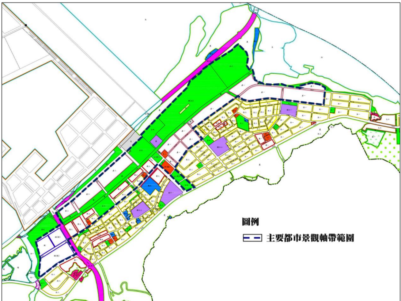
附圖一：臺北港特定區重要軸線範圍圖

八、本審議原則若執行上有疑義時，得經本市都市設計審議及土地使用開發許可審議會作成共通性決議後據以執行。