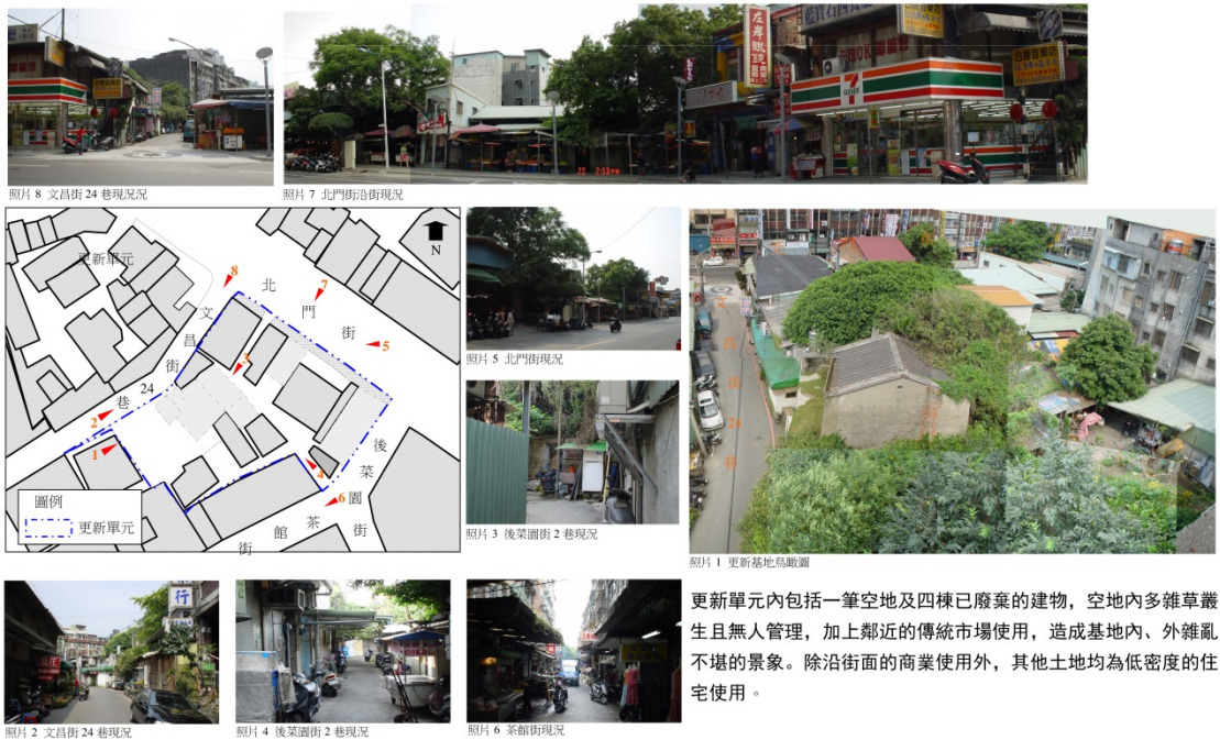
新北市板橋區北門街商業區都市更新案(拆除前)周邊環境概況