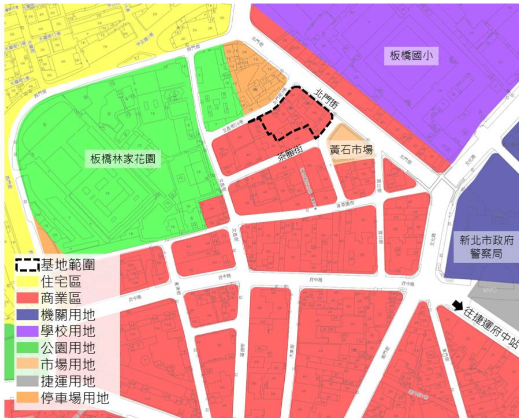
新北市板橋區北門街商業區都市更新案土地使用分區示意圖