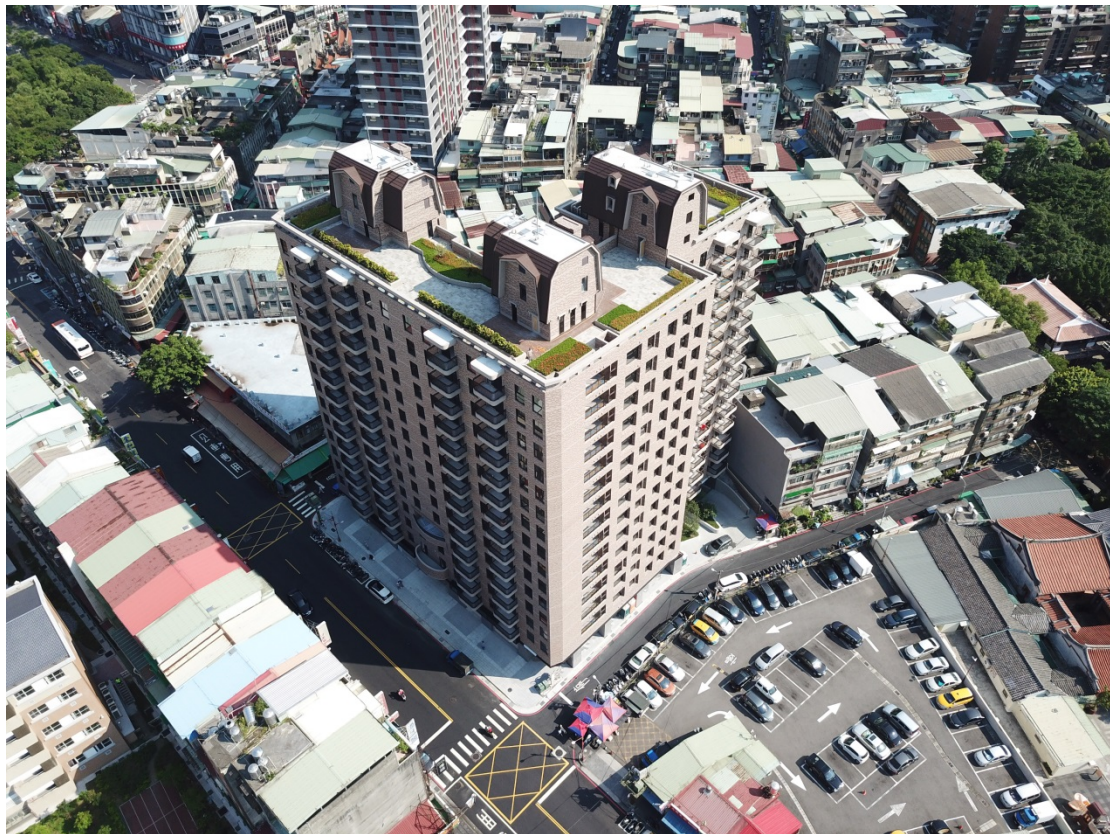
新北市板橋區北門街商業區都市更新案-更新後/現況鳥瞰照