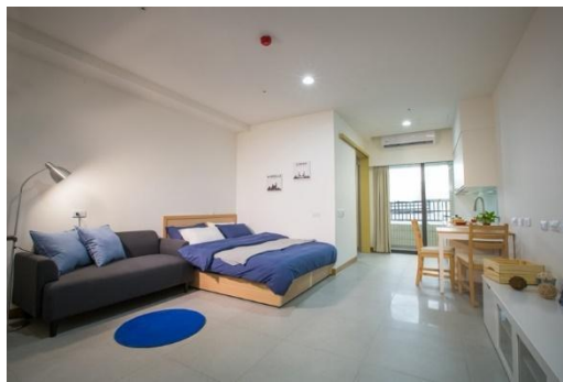
▲套房型 ( 樣品屋 )