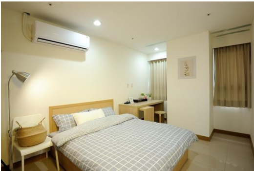
▲三房型（樣品屋）套房