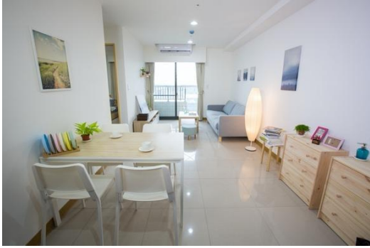
▲三房型（樣品屋）飯廳