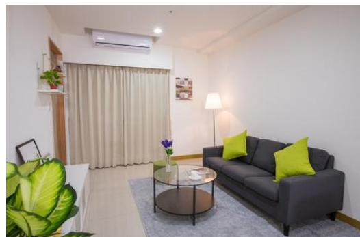
▲二房型 ( 樣品屋 ) 客廳