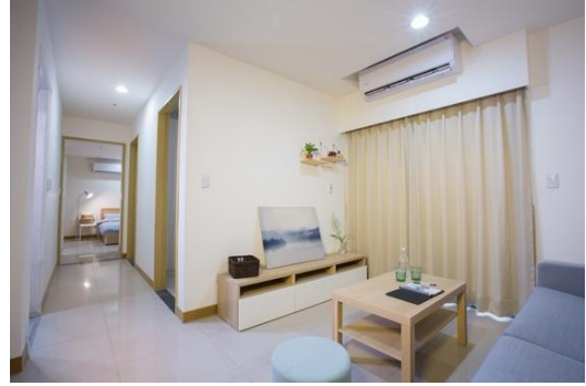
▲三房型（樣品屋）客廳