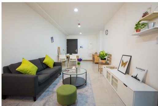
▲二房型 ( 樣品屋 ) 客廳