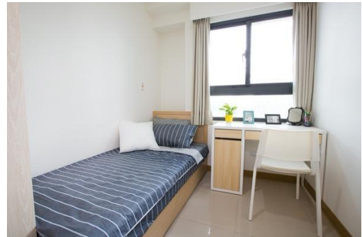
▲三房型（樣品屋）雅房