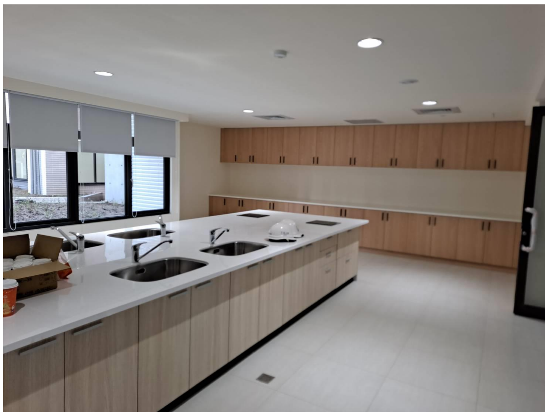
土城員和青年社會住宅共享廚房/客餐廳現況照片